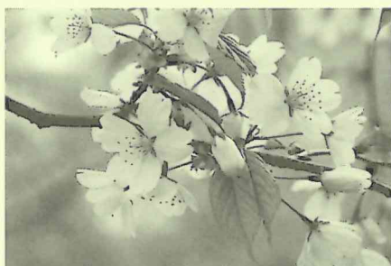
カスミザクラ(磯部桜川公園 2012年4月)

なお、オオヤマザクラ(別名:エゾヤマザクラ)は花や若葉の赤味が強く、ベニヤマザクラとも呼ばれます。筒状のつりがね形の萼筒も赤味が強く、花序の下にある大きな鱗片は指でつまむと粘りがあるのでヤマザクラなどと識別できます。