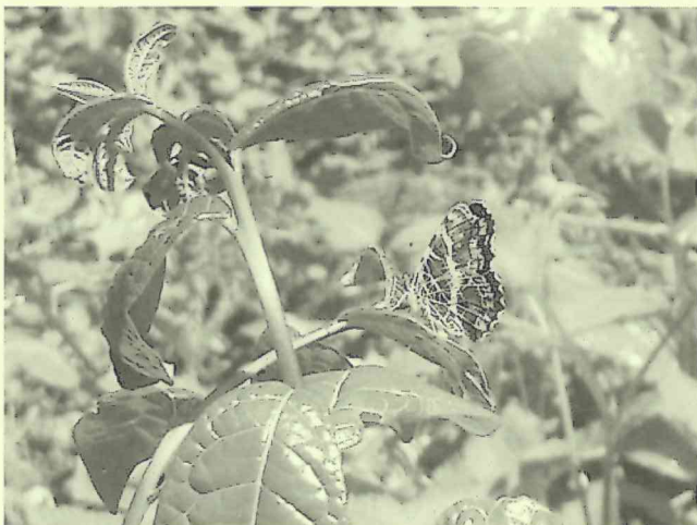
サカハチチョウ。チョウと食草・吸蜜の関係から樹木を観るのも楽しい。

子ども樹木博士を開催されている皆様は、私たちのような自然関連の自主グループとして、あるいは学校や行政などの組織における社会事業の一環としてなど、様々な形で実践されていると思いますので、他のグループとの交流にも様々なかたちがあることでしょう。子ども樹木博士の発表会や、同じフィールドで活動する団体同士の交流会など、もし何かきっかけがあれば参加してみたいかと思いますが、その際、準備は大変ですが、発表者として参加すると得られるものが一層多い気がします。そうでなくても、プログラムの企画や広報のアイデア、活動運営の改善策、思いを共有できる仲間、グループメンバーの意外な特技など、きっと価値ある発見があると思います。