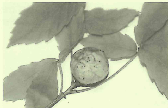
ナラメリンゴフシ(茨城県民の森 2012年5月)

ちなみに、虫えいの名前の付け方は、「植物の種類」+「形成部位」+「形状」+「フシ(五倍子)」とされ、ナラメリンゴフシ(檜・芽・林檎・五倍子)です。コナラやミズナラには、もう一つよく目にする虫えいがあります。ナラメイガフシ(檜・芽・毬・五倍子)です。これはナラメイガタマバチが作るもので、多くの針状片に包まれたイガ状の虫えいです。