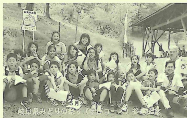
岐阜県みどりの祭り・学びコース（H22.5.22）

9回目は県のみどりの祭りに協賛しました。陶史の森まつりと併行のために前もって市長から依頼があり、実施後は市長から礼状をいただくという初期の頃からは考えられない厚遇となりました。小学4年生17名と先生2名が参加して25本の樹木の学習を行いました。質問も多く、賑やかで楽しく、心意気のある有意義な一日となりました。