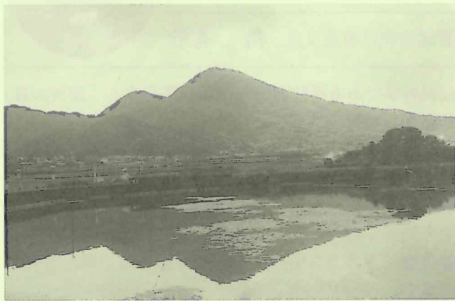
奈良県側の香芝市内からみた二上山

大阪府太子町 たいしちょう と奈良県葛城市 かつらぎし の府県境に、二上山 にじょうざん （万葉の時代には「ふたかみやま」と呼ばれていた。）という古くから人々に親しまれてきた山があります。この山は北側の雄岳(517m)と南側の雌岳(474m)からなり、東と西からはよく見え、見る位置によって微妙に形をかえ、それぞれに趣きがあります。