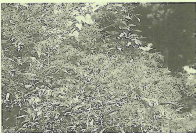
赤く熟したイヌザンショウの実 (写真中央部辺りが赤く熟した実です。)

花と果実が同じ時期に見られる樹木には、シロダモと同じクスノキ科のカゴノキやハマビワがあります。