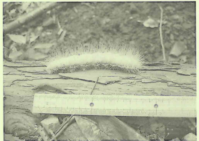
今年の夏に木下沢で見つけたクスサンの幼虫，通称「白髪太郎」。何か見つけたらとにかく記録します。

ほどです。一方で、毎年姿をあらわし産卵するカエル類や、同じ場所に咲く花など、変わらないものを観るとほっとします。また、例年より鳥の数が少なかったり渡りの時期がずれていたりすると、何かあったのか、環境悪化や気候変動の影響だろうか心配になったり、外来生物のハクビシンの数も気になります。