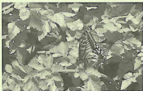
セリの葉に産卵中のキアゲハチョウ

モンシロチョウやアゲハチョウの卵の大きさは1ミリ程度。これが孵化するまでは風雨にさらされても、よほどのことがない限り葉から脱落することはありません。産卵と同時に