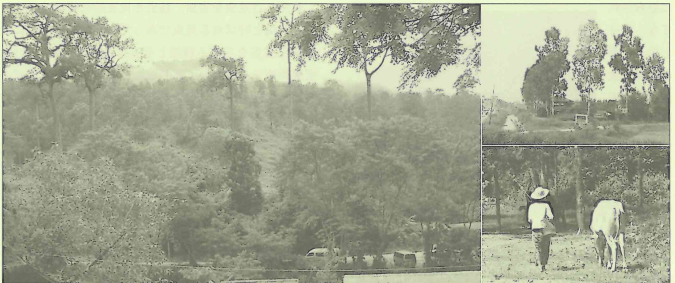
森林と共存することが、生態系や生物多様性を守ることに繋がる。

古くから日本の農山村部で行われて来た伝統的な「里山」での生活も、実は「人」と「自然」とが共生する循環型社会のお手本のようなものでした。そこには、森林の利用と再生、生活環境の保全、食物の生産、多種多様な生物の生息場所の提供など、先人の知恵と経験が巧みに活かされています。里山とは、人の利用と管理によって、はじめて成立する持続可能な環境循環社会の先例なんですね。