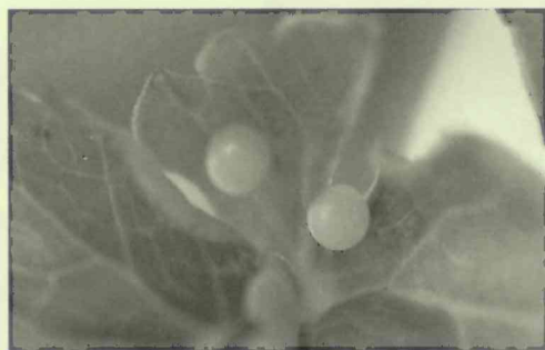
セリの葉に産み付けられたキアゲハチョウの卵

葉に接着するのは、どういう仕掛けなのか。「接着」の専門家に教えを乞うてみたいものです。