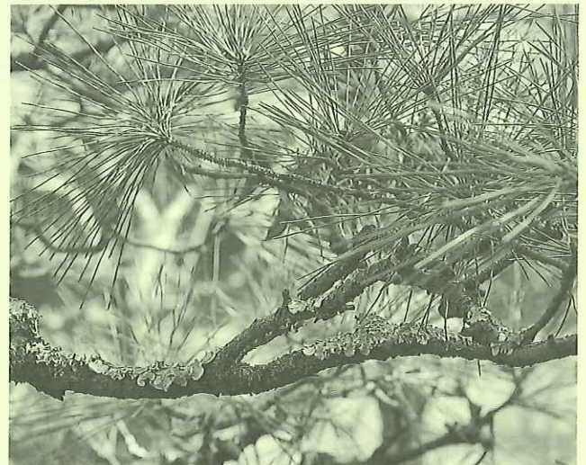
写真2 ウメノキゴケが着いたアカマツの枝

マツを祝い事に用いるのは、長寿の象徴でもあるからです。ただし、老樹の枝を切り取っただけでは、風雪に耐えた老松としての風格が足りません。そこで、確かな証拠として、枝に地衣類のウメノキゴケが着生したものを、「苔松、コケマツ」と呼び、白髪豊かな老人に見立てます。屏風絵や能舞台の背景面のクロマツの幹に描かれた白い模様がそれです。