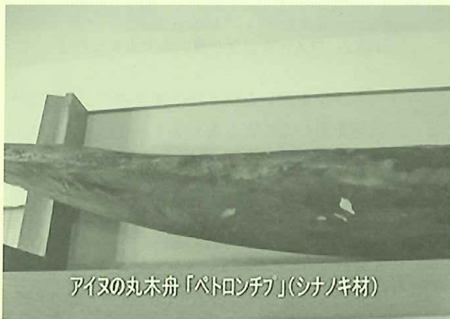
アイヌの丸木舟「ペトロンチア」(シナノキ材)

またベトナム語でも、Thông đuôi ngựa(ホーステイルパイン：馬の尾っぽ松)と呼ばれていて、主に樹脂を採取する目的で、現在も盛んに植林が行われています。集められた樹脂は、様々な用途の化学製品へと姿を変え、材は建築用材や紙などに加工・利用されます。