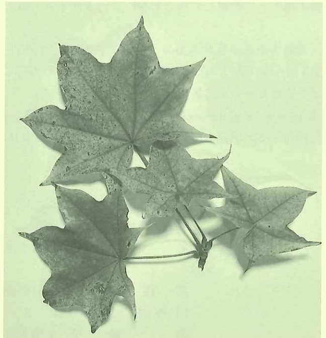
写真は緑から黄色に黄葉し始めたイタヤカエデの葉です

辞典」である、大槻文彦著の『言海』でも、「もみじ」 の漢字は、「黄葉」または「紅葉」と記されています。