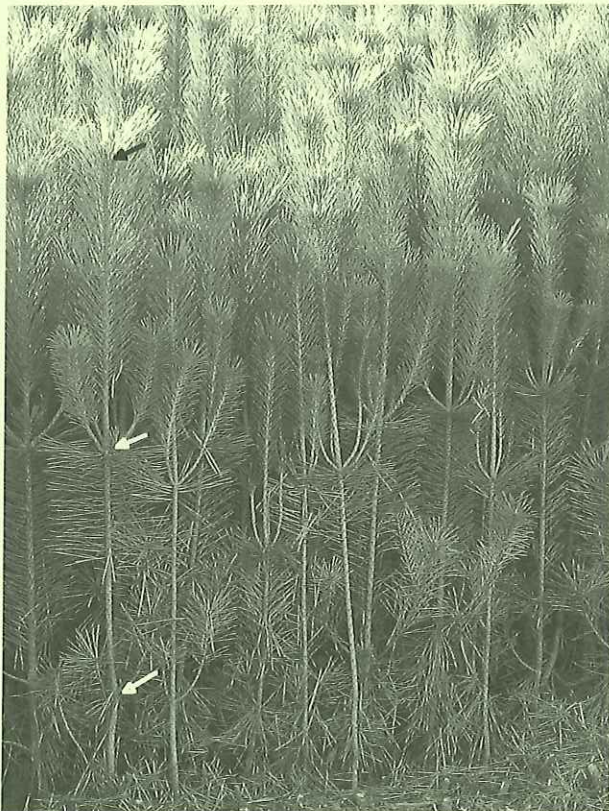
写真1 海岸砂丘に密植されたクロマツ

クロマツの自生地は暖温帯の岩石海岸、潮風に耐えて広がった枝と太い幹が特徴ですが、花屋さんの店頭で見る若松はずいぶん違います。天に向かって伸びる若松の細長い姿は、1年間に50cm以上も幹が伸びる程の優れた土壌条件下で、1㎡当たり100本位に密生させて作ったものです。