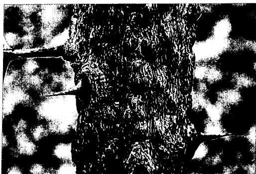
サンショウの木肌