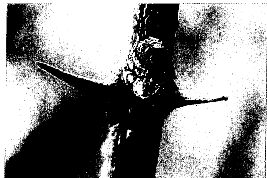
サンショウの冬芽

冬芽はリーゼントに似た形をしており葉痕がかわいい顔をしている。葉のなくなる冬にも樹木博士は冬芽や葉痕を利用すると、また面白い樹木の姿がみられて、楽しめるのではないだろうか。