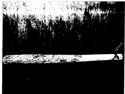
サンショウのスリコギ

椒」と呼ばれ健胃や鎮痛、正月に飲むお屠蘇の材料などに使われる。しびれるくらい辛いのでラーメンに入れてしびれ具合を楽しんでいる人もいるくらいだ。