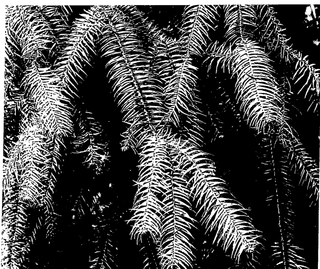
杉木 (日本名: コウヨウザン) の枝葉

10年ほど前に、月例の植物観察会で通りかかった神社で1本のコウヨウザンを見つけ、説明しようと近寄ったところ、シルエットがスギと同じに見えることに気づきました。また、長三角形の葉を3つ並べると「杉」の文字の旁(つくり)、そのままです。だから、日本のスギと混同したのでしょう。