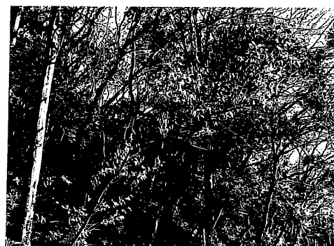
ヤマコウバシ 2019年2月11日

そのほかに、冬の雑木林で見られる、真冬でも葉を落とさない落葉樹として、クスノキ科のヤマコウバシという木があります。この木をよく観察してみると、どうやら、葉と枝の間に「離層」が完全にはできないのではないかと思います。葉柄の中心付近の細胞は春