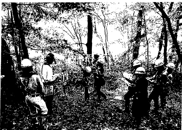
常設コースでの事前学習

自然を解説するという事は、森林の持つ多面的機能について理解を深めてもらうために重要なことであり、同時に、森林に関する様々な施策等への理解も深めてもらえると考えています。今後も、より多くの人に楽しんで参加していただけるように、創意工夫を加えながら活動を進めて行きたいと思っています。